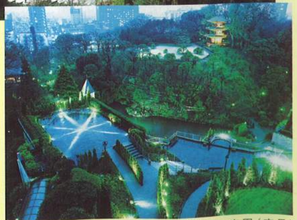
椿山荘・庭園(夜景)

主催：日本小動物獣医師会 後援：文部科学省 (社)日本獣医師会 関東地区獣医師会連合会 (社)東京都獣医師会 (社)日本動物病院福祉協会 (特)野生動物救護獣医師協会 東京都小動物獣医師会